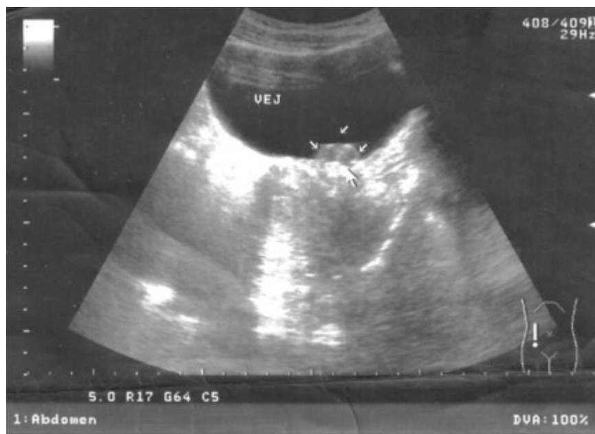
Fig. 1. Ultrasonido abdominal que muestra la lesión tumoral en el fondo de la vejiga (VEJ) señalada con las flechas.

El análisis general de la orina fue normal lo mismo que la analítica sanguínea. En el ultrasonido abdominal se constató la presencia de una lesión tumoral de unos 2 cm de anchura por uno de altura, predominantemente hipoeoica y a nivel del piso vesical (figura 1).