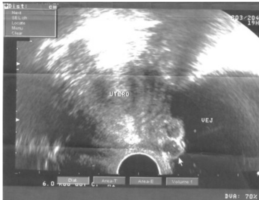
Fig. 2. Ultrasonido transvaginal. Se observan dos imágenes hipocogénicas unidas, redondeadas, de aspecto nodular, en proyección del piso vesical que miden en su conjunto 19 por 12 mm.

Se le indicó entonces el ultrasonido transvaginal donde se confirmó el hallazgo antes descrito, así como la constitución interna de la tumoración vesical, por dos formaciones esféricas hipocogénicas y bien delimitadas; el útero y los anejos eran normales (figura 2). Fue remitida entonces a la consulta de urología.