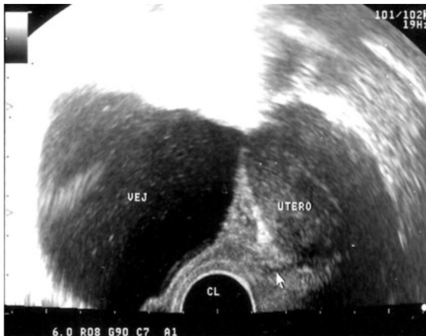
Fig 4. Ultrasonido transvaginal evolutivo, a los 6 meses de operada, negativo de lesión vesical.